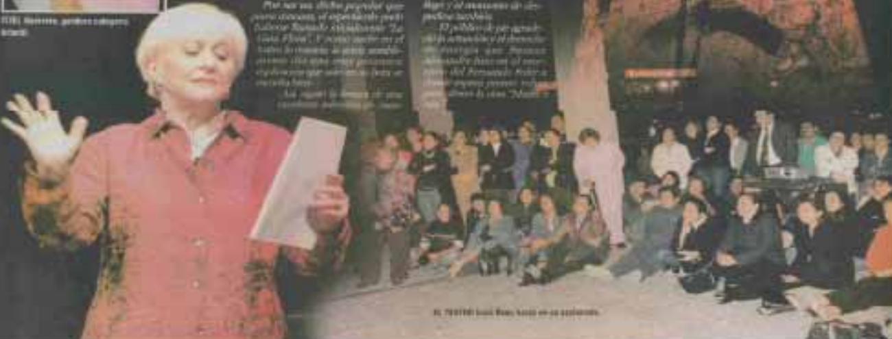
EL TEATRO EN LA PENÍNSULA IBERICA EN EL 2010.

Los días se pasan como la arena entre los dedos. Los días se pasan como la arena entre los dedos. Los días se pasan como la arena entre los dedos.